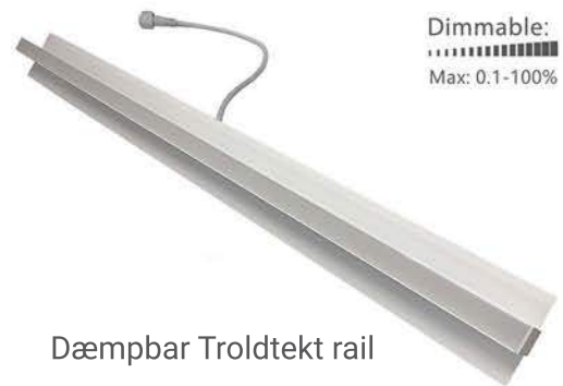
Dæmpbar Troldekt rail